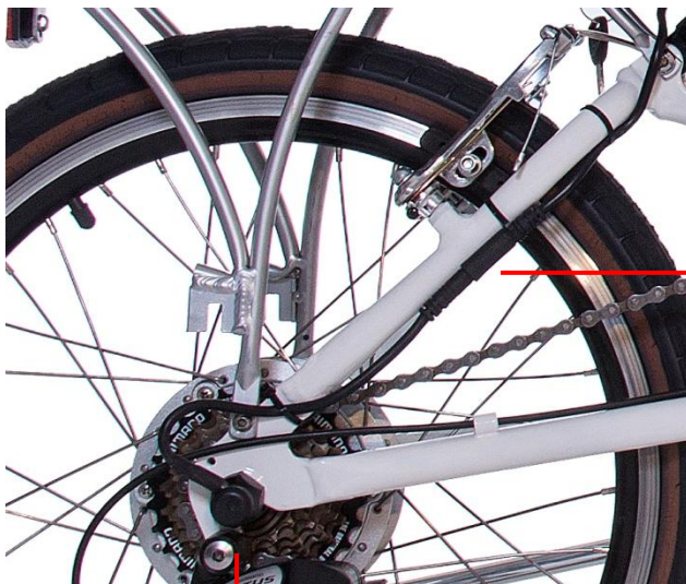
Porcas de aperto

Em caso de furo, para trocar ou consertar a câmara, basta desplugar o conector do motor. Em seguida, ao soltar o eixo da roda, a roda com o motor sairá. Ela deve ser tratada como uma roda normal.