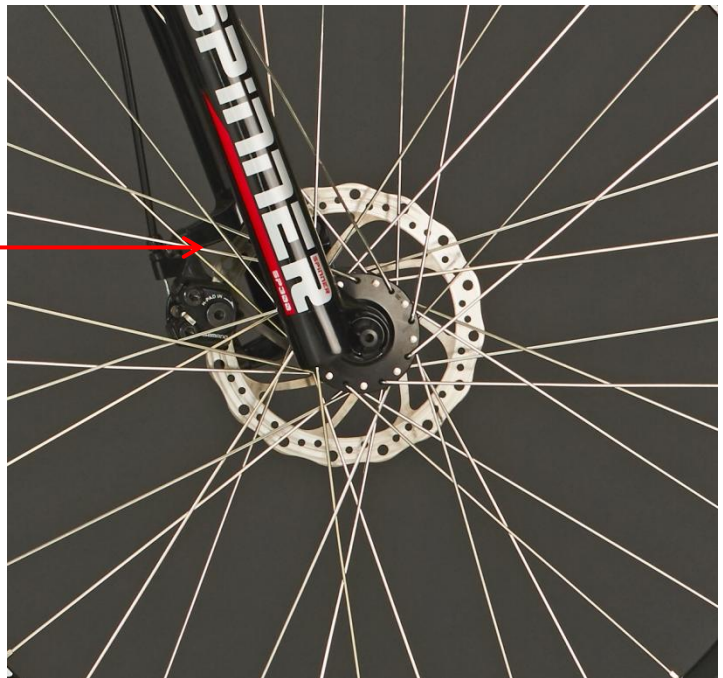
Freios A DISCO